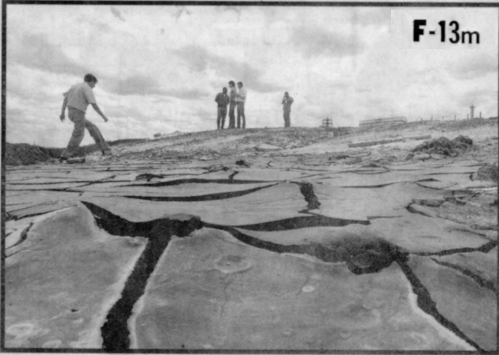
Lama com resíduos da produção de zinco vazou de encanamento e atingiu o córrego Consciência